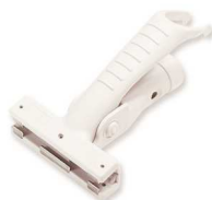
ワンタッチモップ