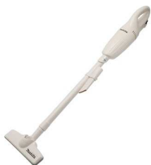
ハンドクリーナー