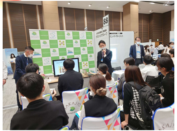
まずはどこかの会場で「合同会社説明会」に参加。

2024卒向け新卒採用プロジェクトが始まりました！まずは「合同会社説明会」に参加し、100名以上の方にタカジョウの魅力をお伝えする事が出来ました！さらに11月7日に第1回目、9日に第2回目の会社説明会が開催され、社長からの熱いメッセージや、事業説明だけでなく、夢や目標を学生達と話し合いながら、素敵な会となりました。今年は一休、どんな学生さん達との出逢いがあるのでしょうか？続報をお楽しみに♪