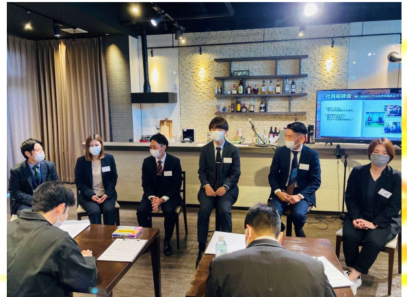
色々なお話を聞いていただいた後に本社社員とガチで質疑応答。