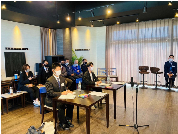
興味を示してくれた学生さんに会社に来ていただきます。