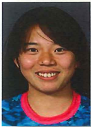
ポジション：MF 7 愛称：みお

コノミヤ・スペランツァ大阪高槻とは、大阪府高槻市をホームタウンとする女子サッカークラブです。