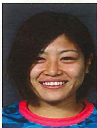
ポジション：DF 8 愛称：なつ

私たちはスペランツァのジョブパートナーである高浄で働いています。清掃道具を持って事業所を訪問するので顔を見かけた際にはお声かけください！！ 今シーズンはリーグが終わりましたが、来年の4月から試合が始まります。高槻のグラウンドでも試合が行われるので是非応援に来てください。