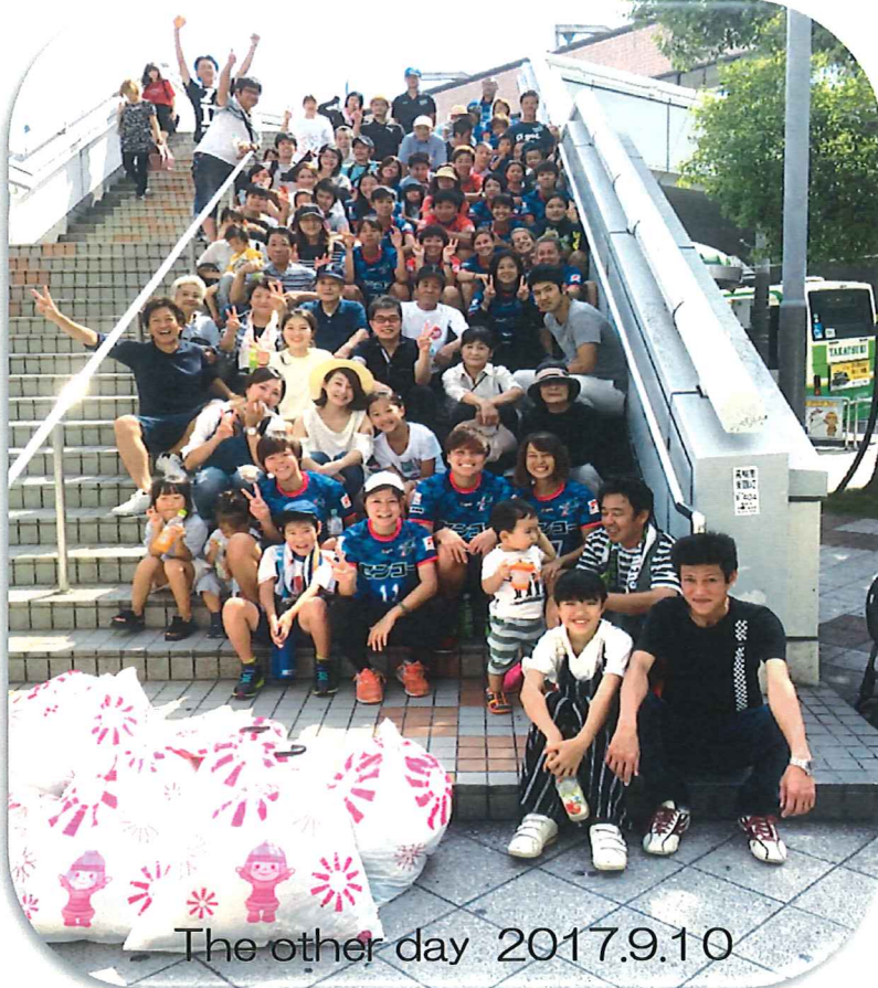
The other day 2017.9.10